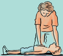
Brust-Kompression mit 1 Hand

KIND (> 1. Lebensjahr) Kompression des Brustbeins um 5 cm