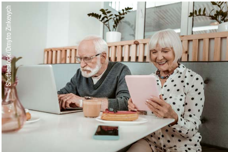
44 Management Digitale Angebote für Senior*innen