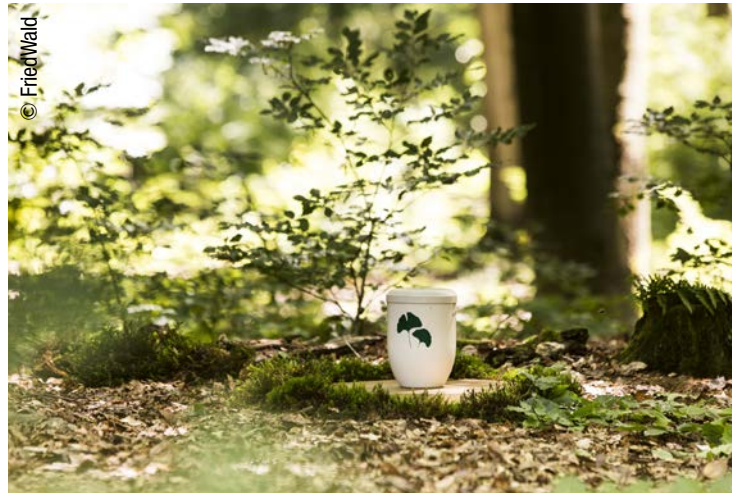
58 Leben Letzte Ruhe im Wald