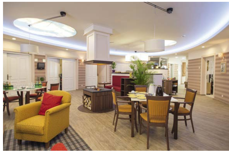
50 Management Pflegeoase Zwickau